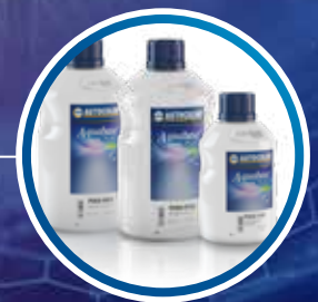
2023 OneVisit™ Converter Nå utvides markedets mest allsidige plattform.