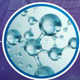
2012 HIGH CHROMA® Toners Klarere og renere farger.