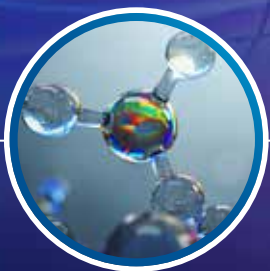
2009 CHROMAFLAIR® Toners Flerfarget effekt.