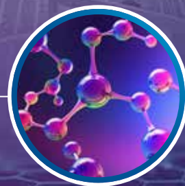
2018 ANDARO® Toners Dype, rene og levende farger.